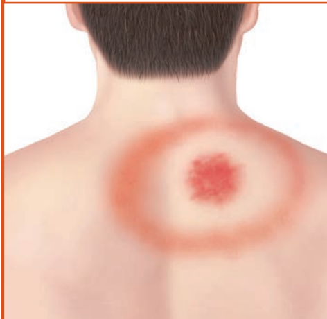
Erupción de "ojo de toro" en la espalda.